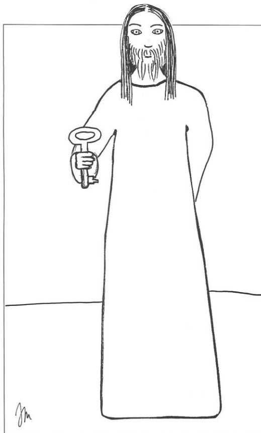
21. neděle v mezidobí cyklu A Mt 16,13-20