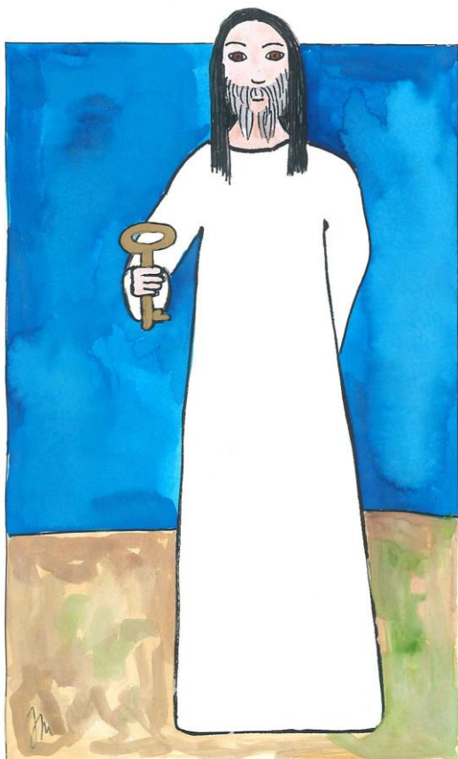
21. neděle v mezidobí cyklu A Mt 16,13-20