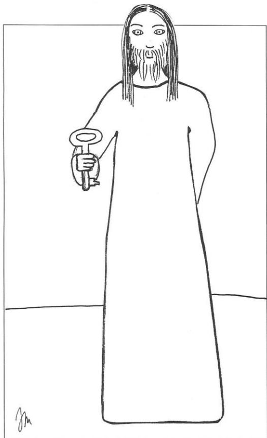
21. neděle v mezidobí cyklu A Mt 16,13-20