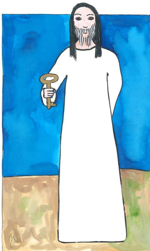
21. neděle v mezidobí cyklu A Mt 16,13-20